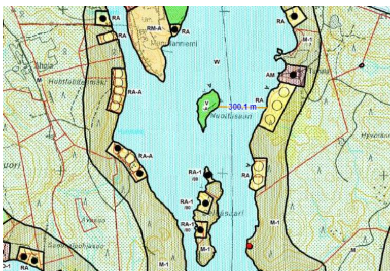
KUVA 14. Alueen kaavatilanne

rakennuspaikoista on osoitettu ranta- asema- kaavassa (länsipuoli) ja osa yleiskaavassa. Nuottasaaren itäpuolen mantereella on kaavassa osoitettu kolme rakentamatonta lomarakennuspaikkaa. Ne vaikuttavat maastotietoaineiston perusteella olevan edelleen rakentamattomia. Ne sijaitsevat lähimmillään noin 300 metrin etäisyydellä Nuottasaaren rannasta. Rakentamattomien rakennuspaikkojen pohjoispuolella on osoitettu maatalan aluetta merkinnällä AM.